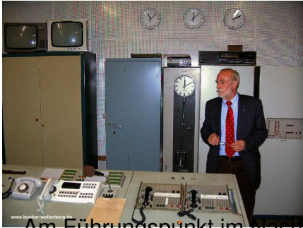
Am Führungspunkt im Bauwerksrichtendispatcherraum

Montag, den 23. Mai 2005 um 19:44 Uhr - Aktualisiert Sonntag, den 22. April 2012 um 22:14 Uhr